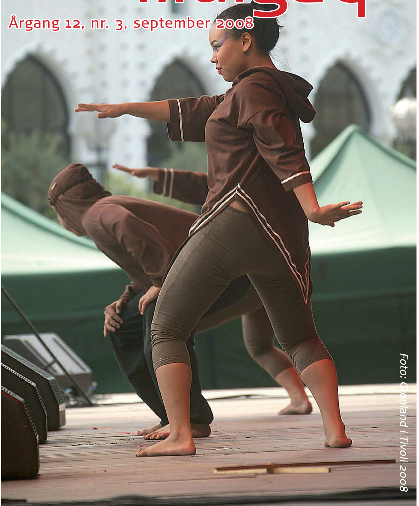
Foto: Grønland i Tivoli 2008