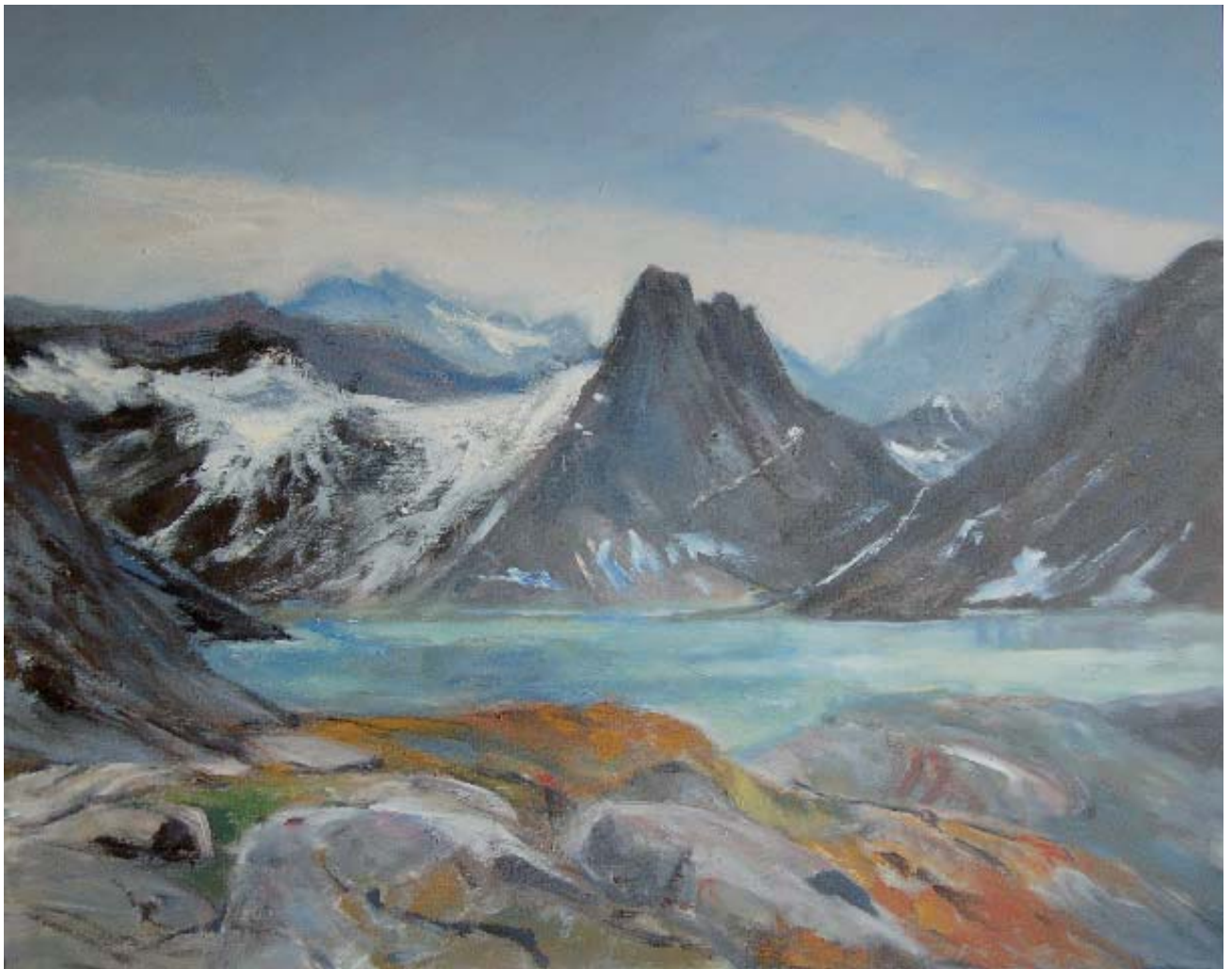
Maleri af Eve Eisenhardt