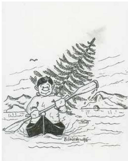
Julekort 1996.