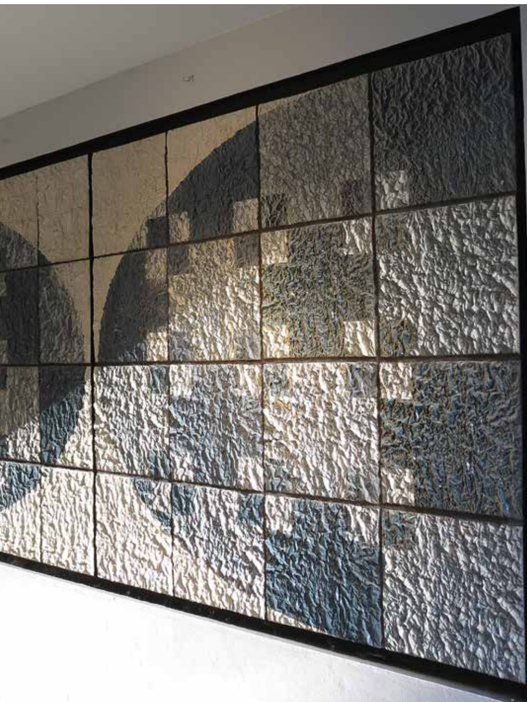
Det færdige resultat, indgangspartiet 2010.

Arctic Slope / Arctic Inflow Arctic Slope / Arctic Inflow Arctic Slope / Arctic Inflow