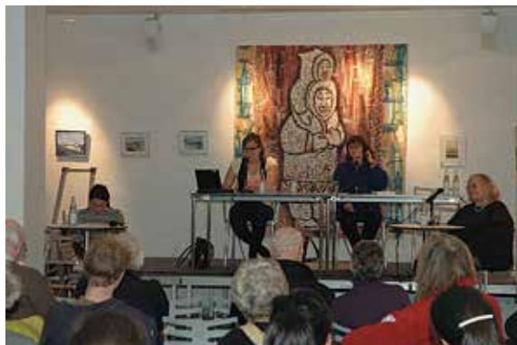
Debatmøde om Selvstyre i Grønland, 2008.