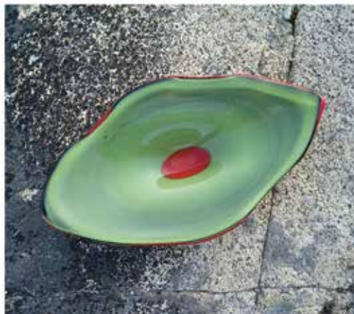
Galleri KALAK plakat, 2011.