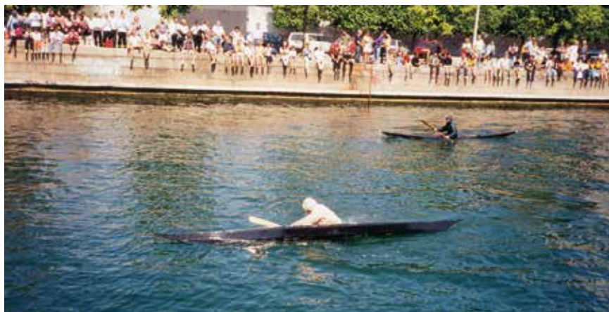
Nationaldag 1998. Kajakopvisning i Københavns havn.