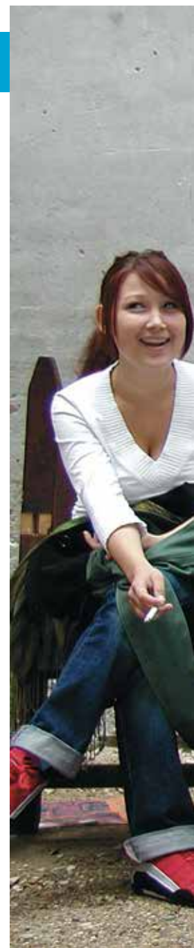
Efterskoleelever 2008.