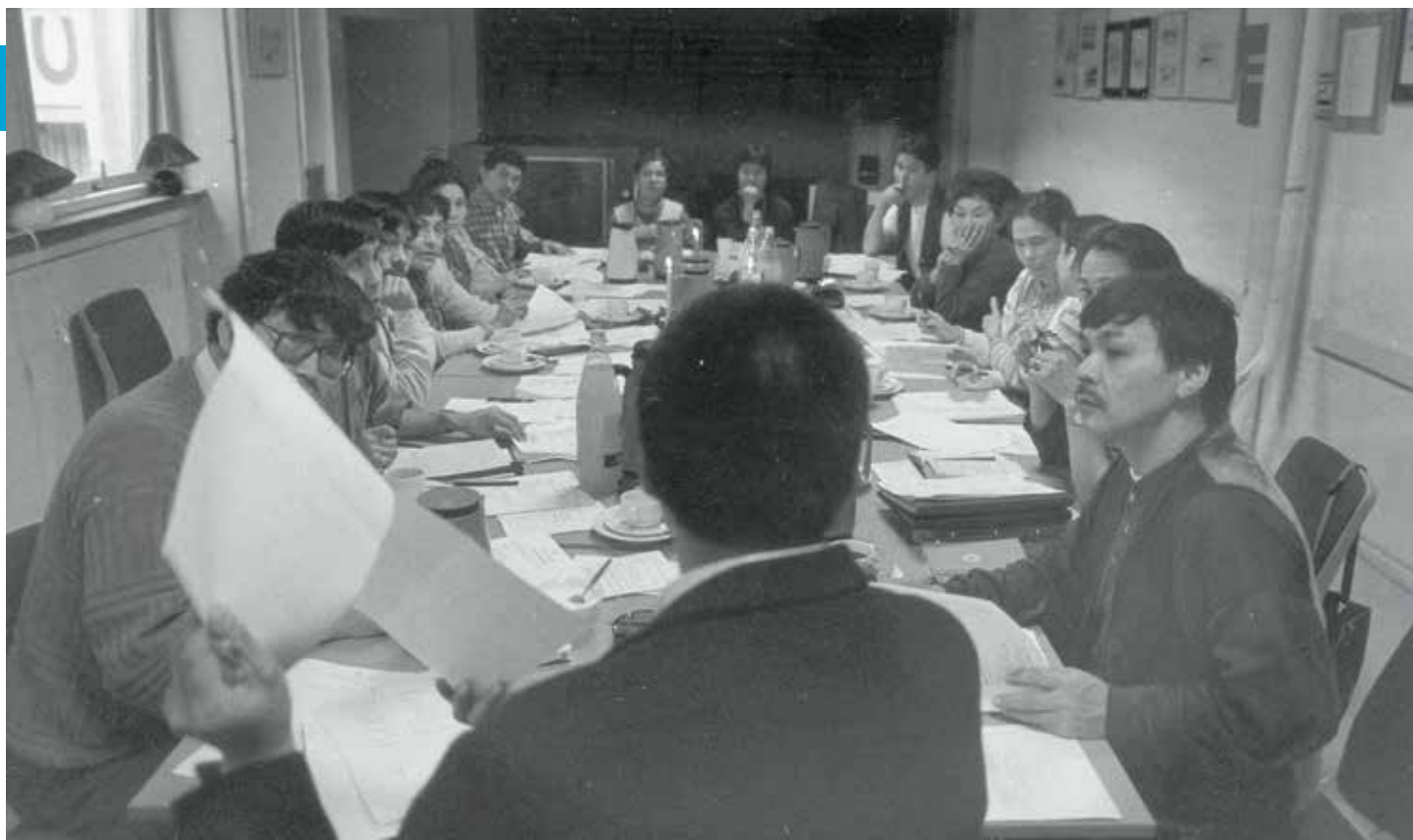
Møde i Kalaallit Illuutaat, feb. 1996.