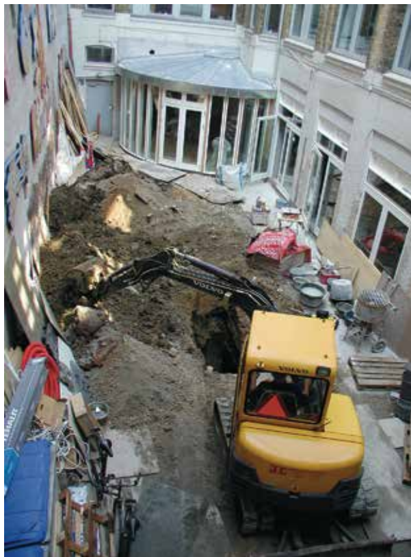
Gården graves op. Renovering 2006.