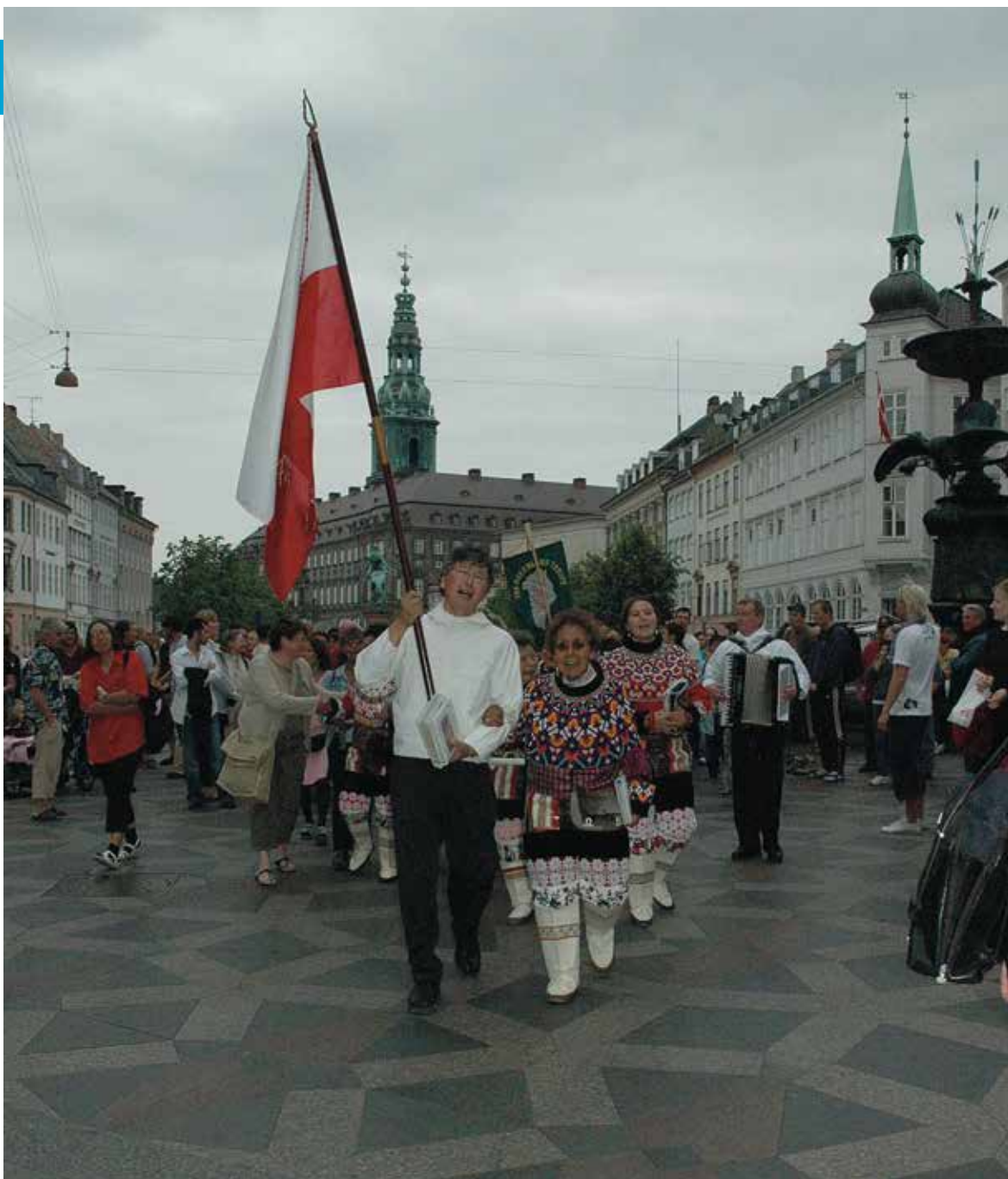
Nationaldag 2006.