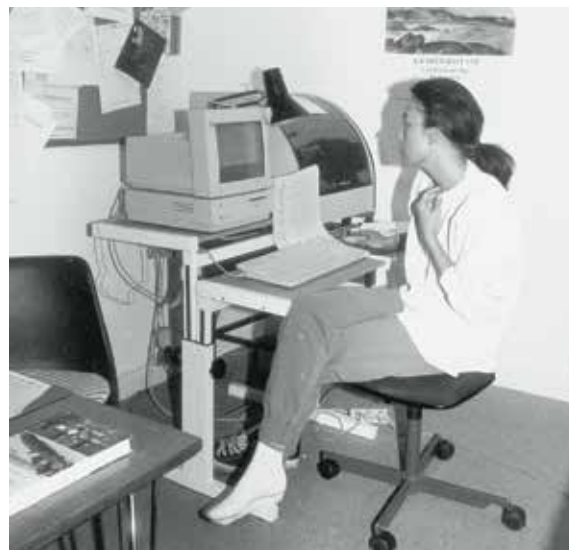
Fra de studerendes kontor 1992. Eksamensforberedelse i KEKIP's lokale.