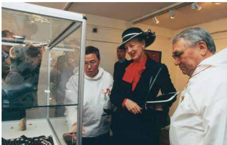
25-års jubilæum 1999. Thue Christiansen, Hendes Majestæt Dronningen, Jonathan Motzfeldt.