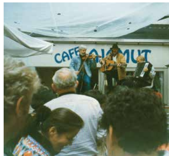
Nationaldag med Poul Dissing.