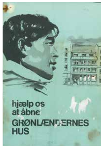
Forside til pamflet om den store offentlige indsamling i 1973.