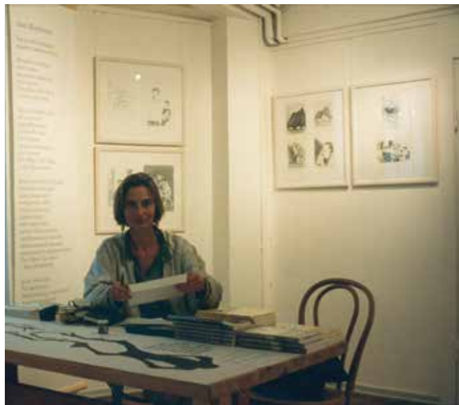
Udstilling med værker af indsatte i Herstedvester, Pernille Kløvedal Reich 1992.