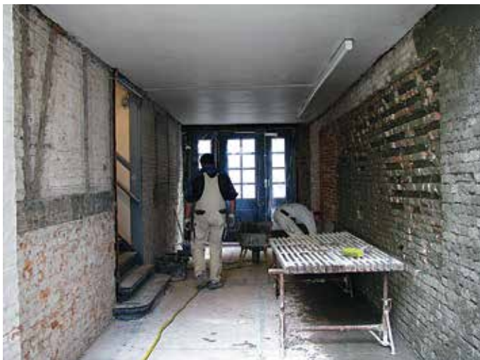
Indgangspartiet under renovering, 2009.