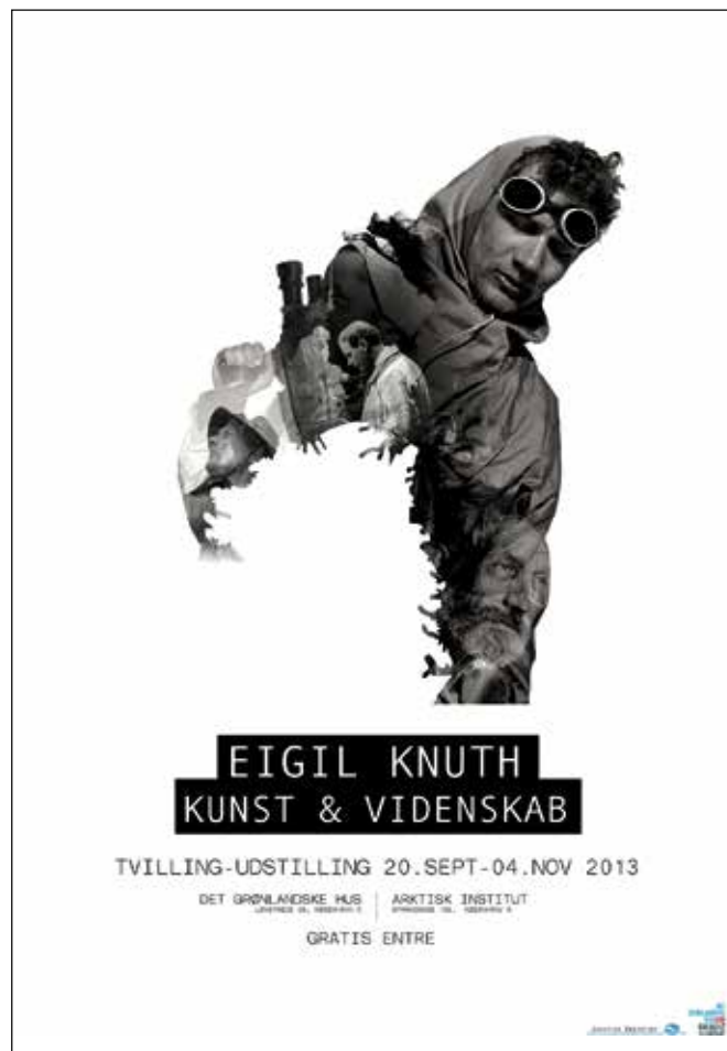
Plakat til »tvillinge-udstilling« om Eigil Knuth.