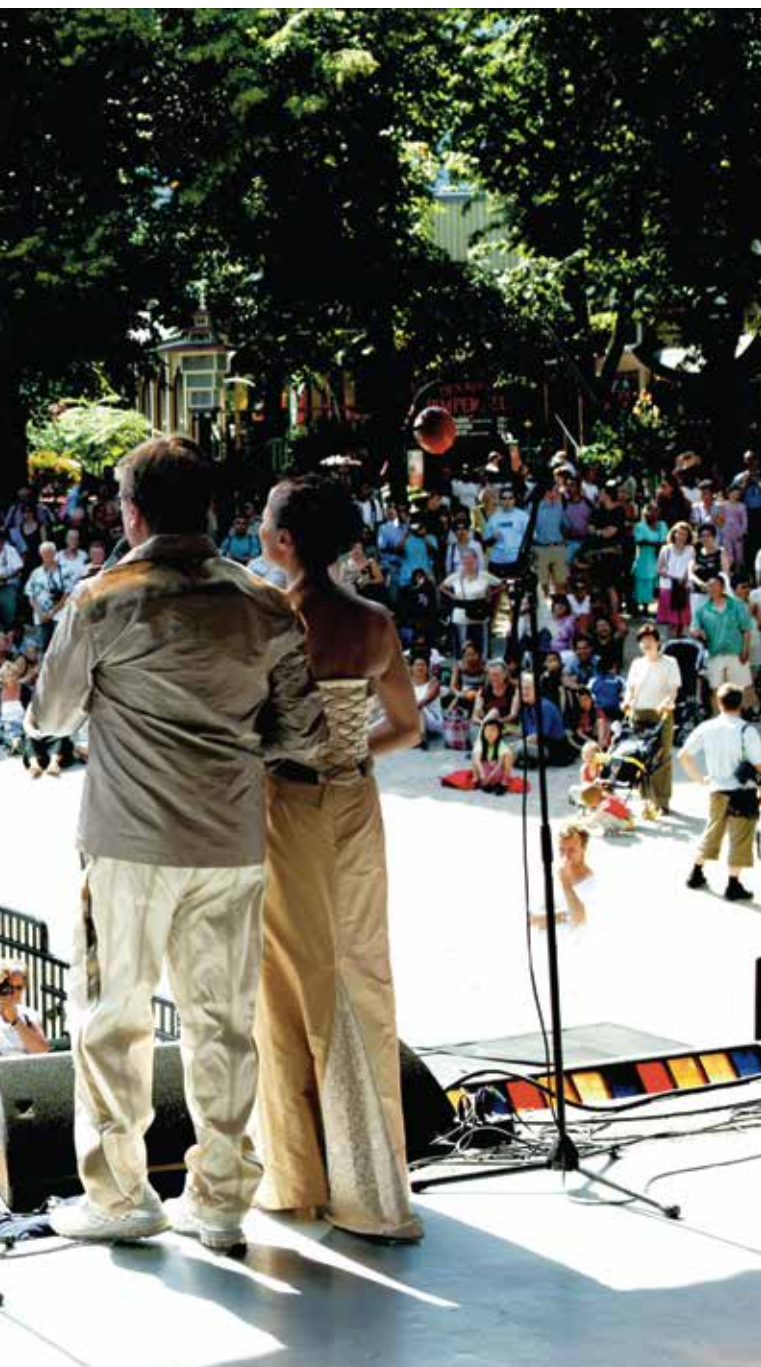
Grønland i Tivoli 2003.