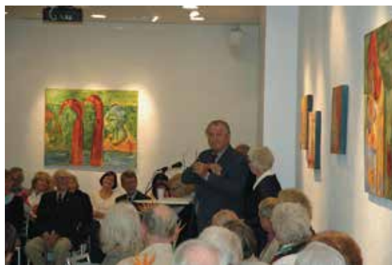
Bogpræsentation med Hans Kongelige Højhed Prins Henrik, 2009.