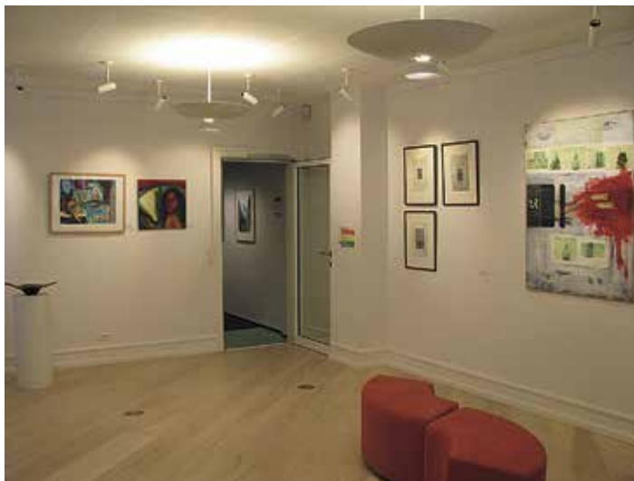
Galleri KALAK, 2011.