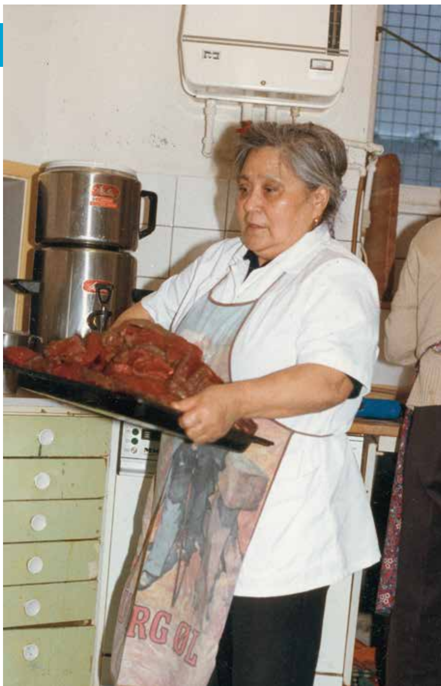
Så er der neqi. Sofiannguaq, Grønlandernes Hus, 1987.