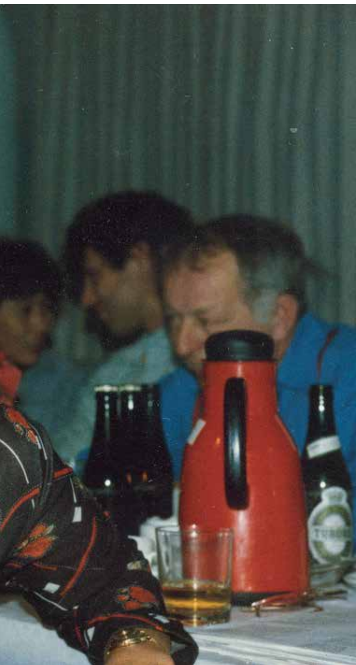
Glad kvinde til fest i Grønlandernes Hus, slutningen af 1970'erne/starten af 1980'erne.