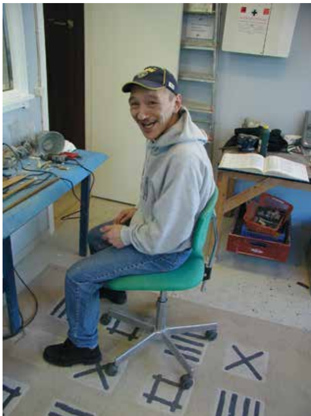
Bruger i Qiperoq, 2004.