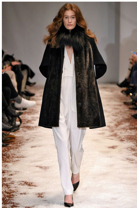
Modeshow med kollektion af sæl.

Salg af Great Greenlands mange produkter foregår på Grønland, men ud over det har de også sælgere spredt både inden- og uden for EUs grænser. Great Greenland afsætter dermed deres produkter udenfor Grønland sammen med deres samarbejdspartner i Danmark, som har ansvar for salg af skind og færdigvarer i hele verden. Great Greenland sælger til den internationale beklædningsindustri og er på auktion gennem Copenhagen Fur. Derudover er Great Greenland også at se på messer både i Danmark og i udlandet.